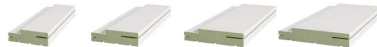
BR73 Batente Regulável 73 x 30 mm